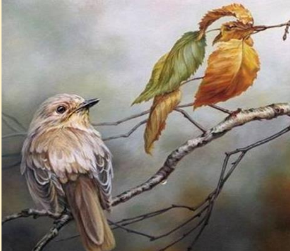
TWEE MEDIA -- TWEE UITZONDERLIJKE VOGELS: digitale twetteraar & losbladige vreemde vogel

Hoe uitzonderlijk de twee publicatiekanalen van onze eigen HBO-Jaargang 1962-1967 zijn wordt nog eens onderstreept door de volgende feiten -- voor zover ik die heb kunnen achterhalen: