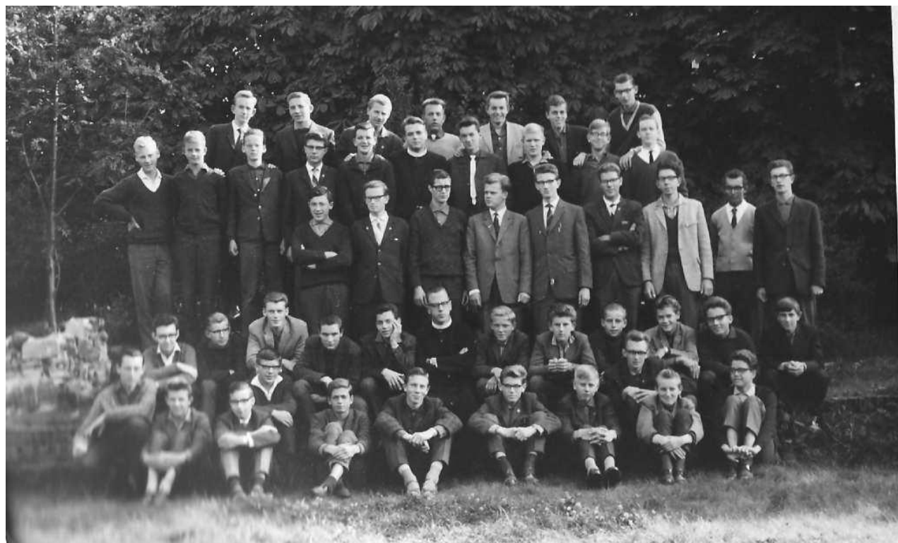
ONZE LICHTING 1962 – 1967 --- foto genomen na onze ontgroening in 1962

De Typeringen uit onze Afscheidsbundel Nou Tot Ziens dan maar worden op de volgende bladzijde weergegeven omdat niet iedereen een exemplaar van het origineel heeft bewaard.